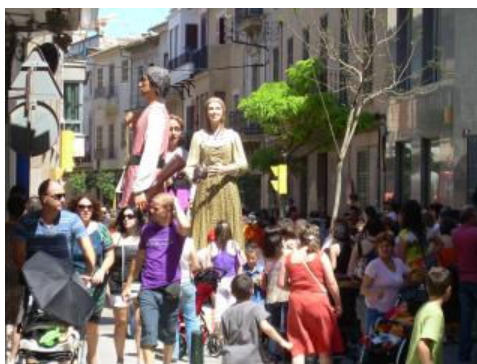
Los 'gegants' recorrieron ayer las calles más céntricas de Manacor.

El contexto fue el mismo para todos –un día soleado que anunció que el verano ya ha llegado–, pero los protagonistas fueron diferentes. En Manacor, los imponentes gegants se apoderaron de las calles ante el asombro de los más pequeños. La gastronomía, en cambio, acaparó el interés en sa Pobla, donde se celebró la segunda edición de la Fira Nocturna de la Patata, mientras que en Sóller la naranja reinó durante toda la jornada. En resumen, una variada oferta en el sábado de fires y muestras que vivió ayer la Part Forana.